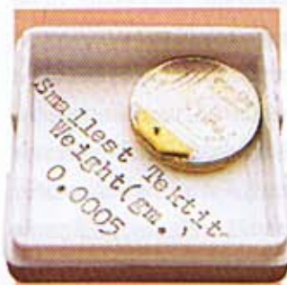
สะเก็ดดาวที่เล็กที่สุดในโลก น้ำหนัก 0.0005 กรัม / Smallest Tektite Weight 0.0005 gm.

จากนั้นคุณบุญมันก็เริ่มเสาะแสวงหาและสะสมเรื่อยมา โดยตั้งทีมค้นหาเอง ด้วยการวิเคราะห์จากทฤษฎีต่าง ๆ ว่าสะเก็ดดาวตกสู่พื้นโลกบริเวณไหน สำหรับในเมืองไทยพบแถบภาคอีสานที่จังหวัดอุบลราชธานี